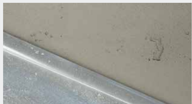
Oberfläche mit Lunkern