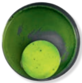
Kein Filmschutz: Algen und Pilze befallen die Fassade

RELIUS RELINOVA BIO CLEAN wirkt nur dort, wo die Wirkung benötigt wird – nämlich an Fassadenflächen. Hier entfaltet sich die komplette Schutzfunktion des mineralischen Filmschutzes, ohne die Umwelt unnötig zu belasten.