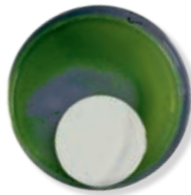
RELIUS RELINOVA BIO CLEAN: Fassade bleibt im Einklang mit der Natur langfristig schön und algenfrei

Ergebnis: Langfristig schöne, algen- und pilzfreie Fassaden. Und das mit einem Filmschutz auf mineralischer, natürlicher Basis.