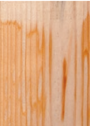
Herkömmliche Lasur farblos Conventional colourless glaze

The UV system has passed the field test on numerous objects. One example: The pictures on the left show the difference between a conventional aqueous glaze and the new glaze olassy UVL-Lasur. The weathering test was implemented at a 45° southward slope 1,300 m above sea level over more than two years. The result is impressive: RELIUS olassy UVL-Lasur provides reliable protection from weathering and greying even in problematic, resinous knothole areas.