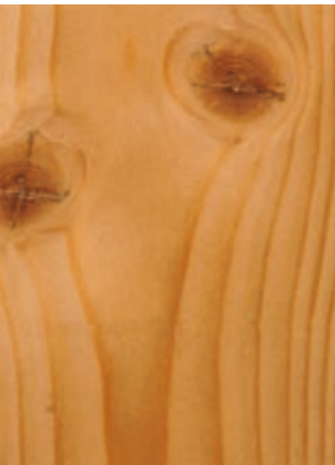
olassy UV-Lasur farblos olassy UVL-Lasur, colourless

Die nanoskaligen, farblosen Pigmente remittieren – also reflektieren – das auftreffende farbige langwellige Licht im Farbton des Holzes.